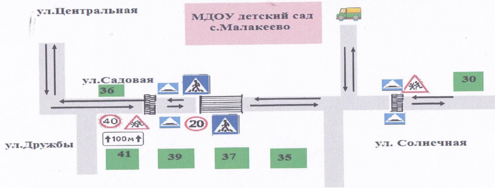
Схема движения грузового транспорта к МДОУ детский сад с.Малакеево