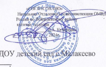
Схема пеших маршрутов родителей и воспитанников МДОУ детский сад с.Малакеево